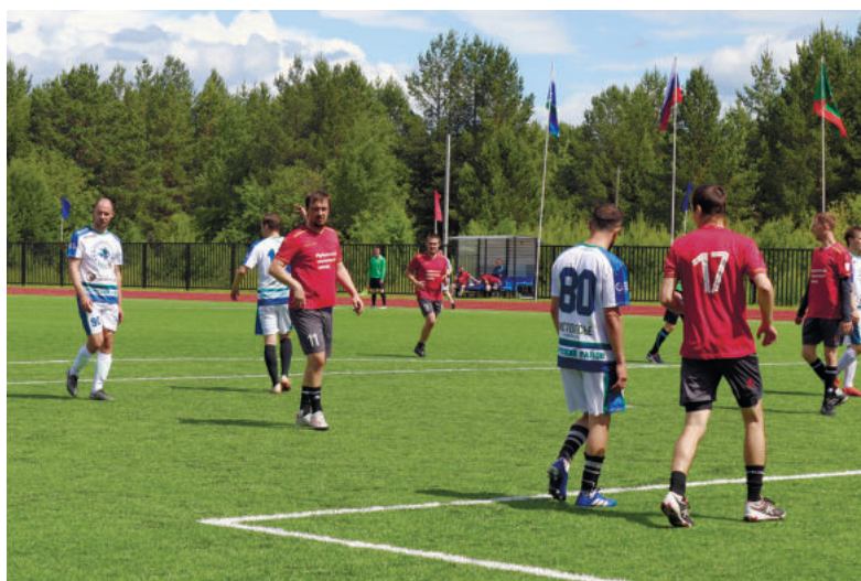
Футболисты Ирбитского молочного завода – бронзовые призеры областного спортивного фестиваля.