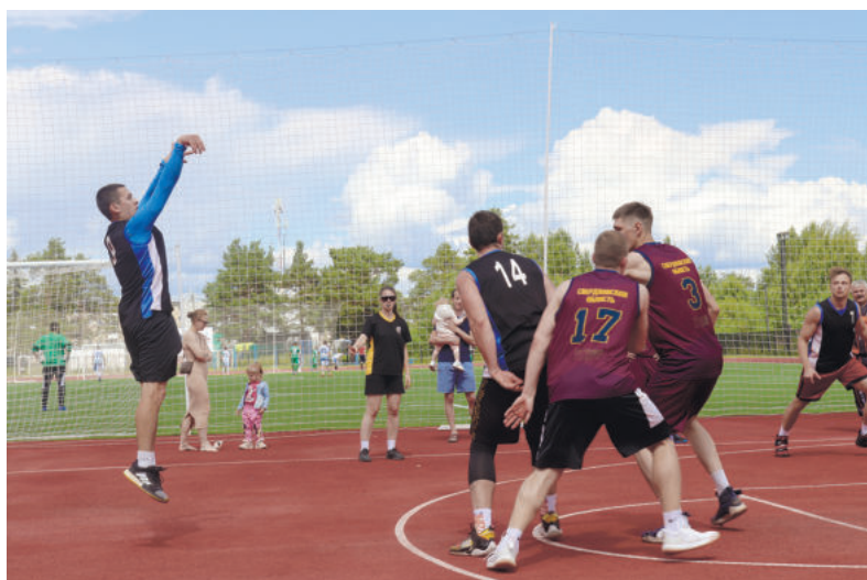
Нашим баскетболистам до победы не хватило лишь одного очка. В итоге команда заняла второе место.