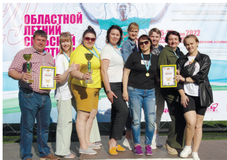
Команда ирбитских волейболисток вновь подтвердила статус сильнейшей. Как и в 2019 году, женщины завоевали «золото».